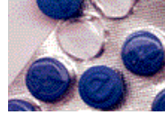
Extasis con efedrina. Dificultad para tener consciencia de lo que está pasando, esto puede ser fatal.

Cuando una droga en particular es contaminada o cortada con otra, no se considera como mezcla “cocktailing”.