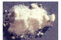
Ketamina o GHB o antidepresivos con alcohol, potencialmente letal. Los sistemas respiratorios y cardíacos pueden bajar a niveles sumamente peligrosos, causando así la muerte en el usuario.

Recordemos que cada individuo es diferente y que la interacción entre drogas es compleja. El mejor consejo es evitar mezclar las drogas, incluyendo el alcohol y las drogas recetadas. Pero si alguna persona decide mezclar drogas, se aconseja que le informe a otras personas las drogas que está mezclando. Esta información será útil en una sala de emergencia.