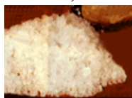
“Poppers” con éxtasis o metanfetamina o cocaína. Aumento en las palpitaciones con el alto potencial de causar un ataque al corazón.

Como muchas de las drogas que se compran en la calle están contaminadas o se cortan con otras sustancias, es difícil determinar los efectos o consecuencias de estas mezclas en el usuario. Por ejemplo, lo que se vende como éxtasis contiene otras drogas, algunas peligrosas tales como el DXM (dextrometorfán, un supresor para la tos y una droga disociativa) y PCP (penciclidina, droga sintética utilizada como analgésico y anestesia y que también es una droga disociativa).